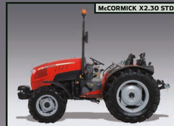
MCCORMICK X2.30 STD