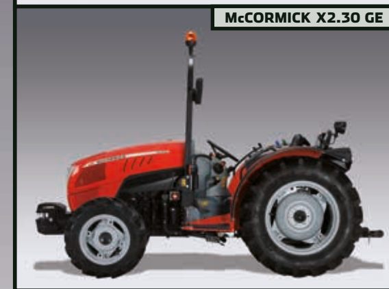
MCCORMICK X2.30 GE