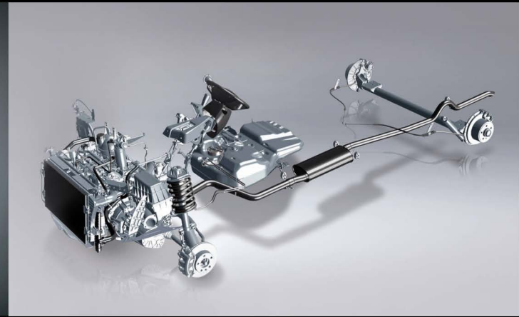
Suspensión delantera independiente