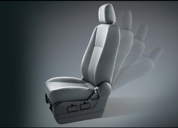
Asiento del conductor con 8 posiciones y apoyabrazos