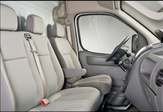
Amplio habitáculo diseñado ergonómicamente